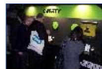
Alcatel sus pri termin. Androi