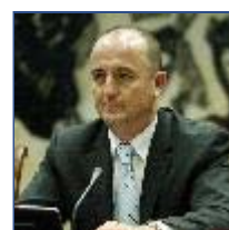
Industri un pla la trans pymes