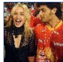
Madon carnava Luz