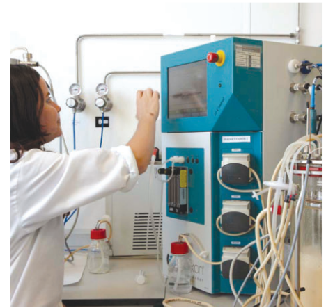
Imagen del Departamento de Bioprocesos

En definitiva, un proyecto empresarial con fuerte componente investigador que exige el mantenimiento de una plantilla altamente cualificada, la adquisición de gran cantidad de equipamiento tecnológico y la movilización de numerosas empresas, centros de investigación y universidades. Pero también, con grandes posibilidades de alcanzar una fuerte repercusión en una sociedad que se hace eco rápidamente de cualquier avance frente a los grandes problemas médicos y medioambientales que nos afectan.